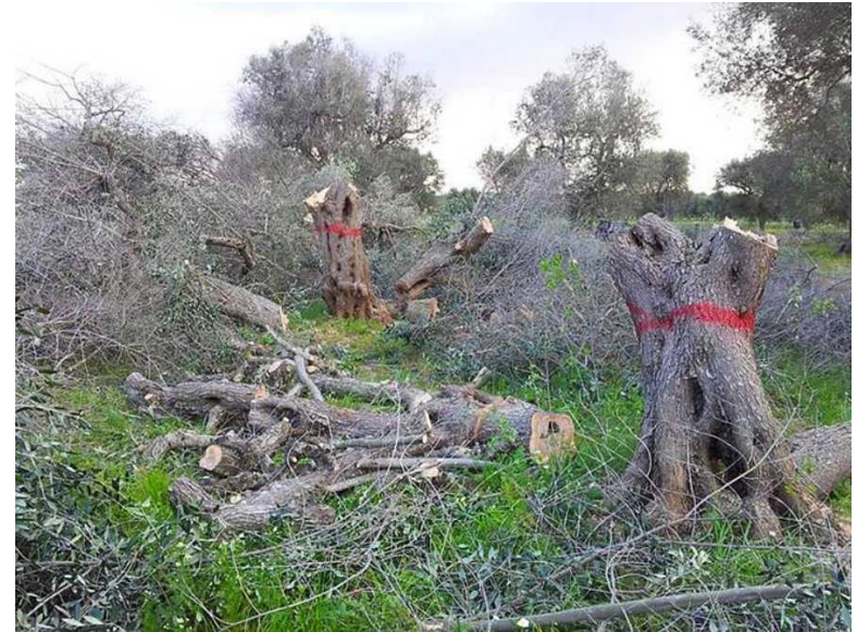
Abattage d'oliviers infestés par Xylella fastidiosa