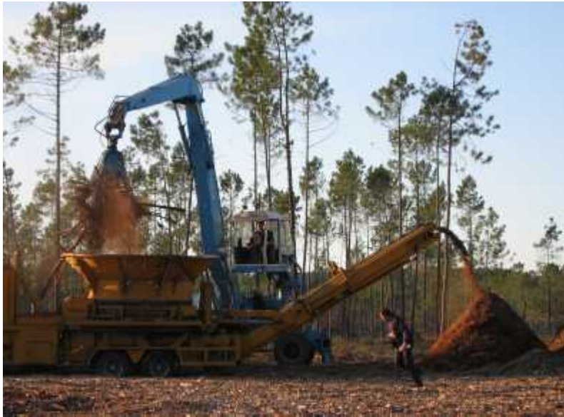
Pins broyés pour lutter contre le nématode du pin