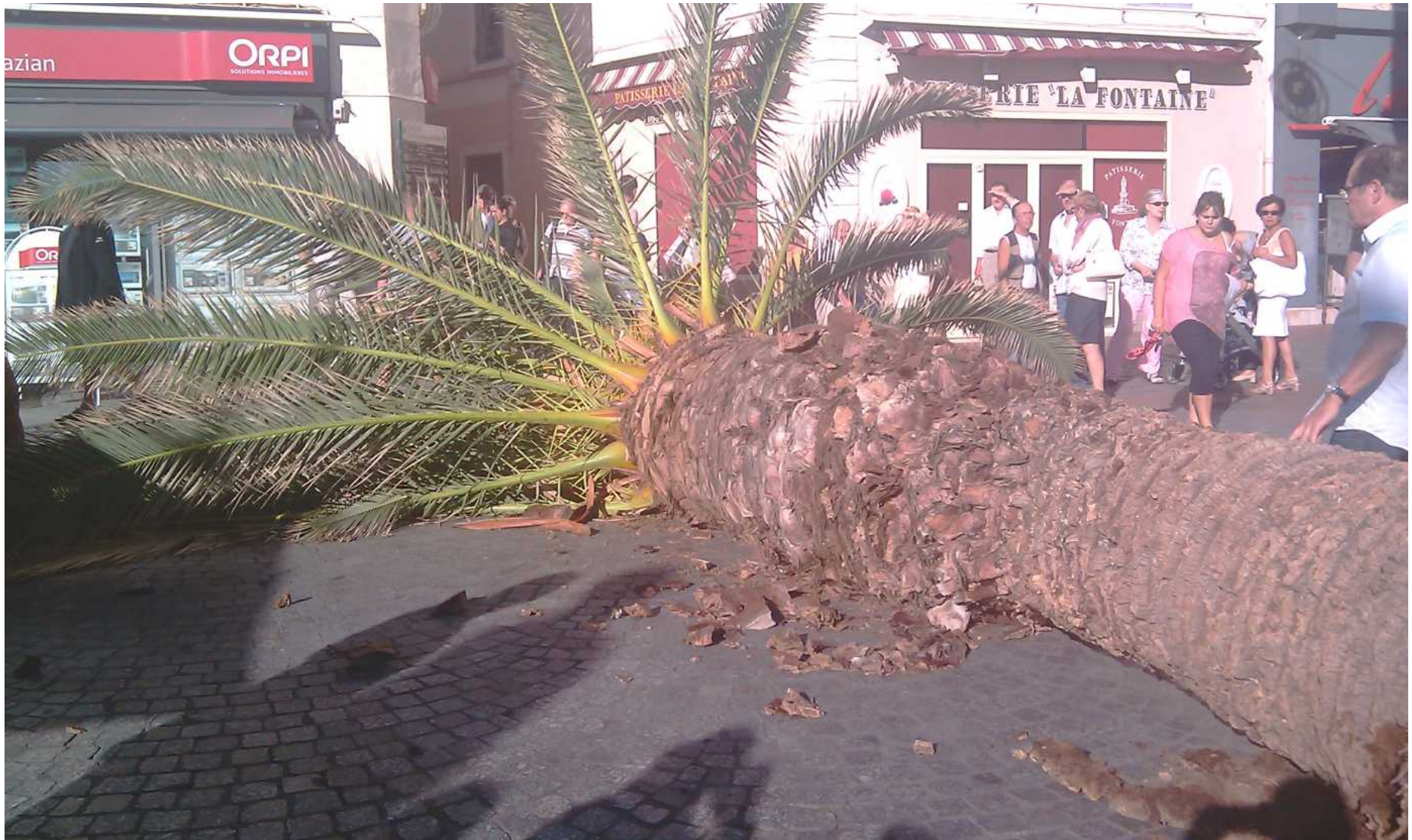
Le 9/10/12 à Sanary